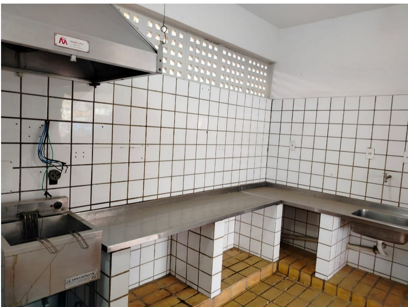
Preparo e Atendimento