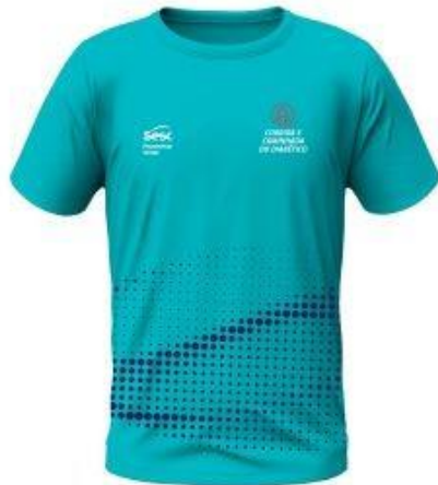
CAMISA DO ATLETA