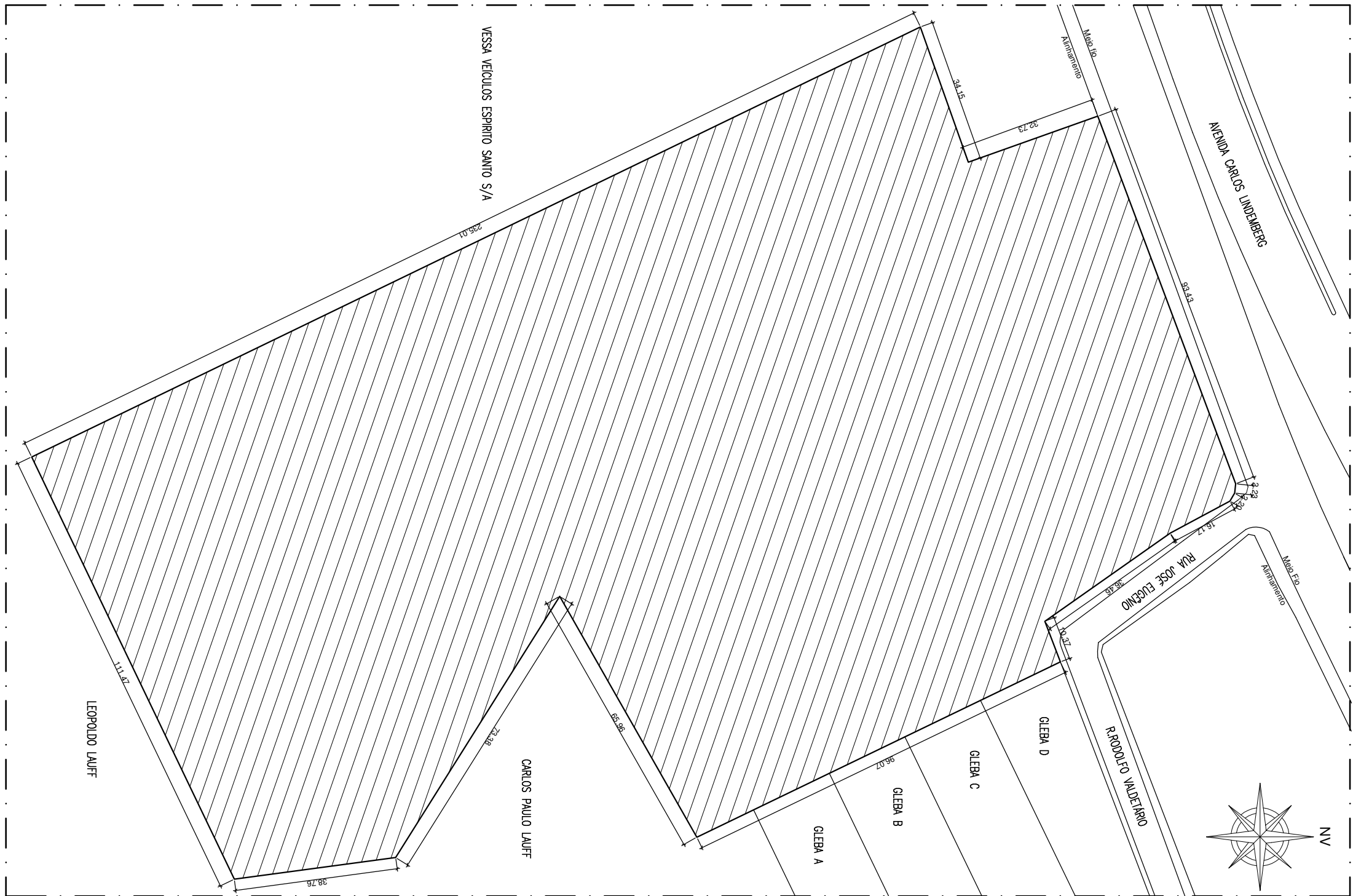
PLANTA DE SITUAÇÃO ESCALA: 1:1000