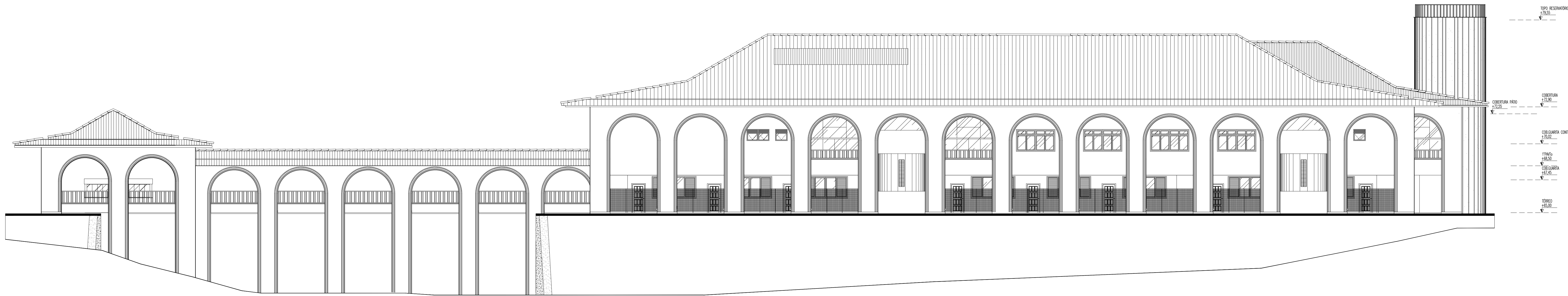
FACHADA LATERAL DIREITA ESCALA: 1/125